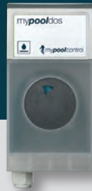
mypoolcontrol >> EASY DOS <<