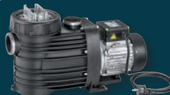
>> FILTERPUMPE <<