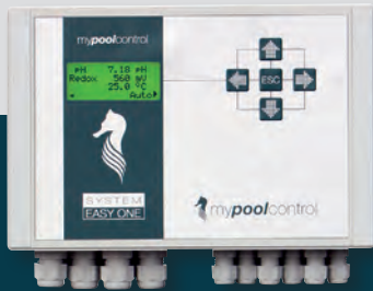
mypoolcontrol >> EASY ONE <<