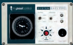
mypoolcontrol >> EASY PRO <<

mypoolcontrol – Technik und Leistung „ALL INCLUSIVE“.